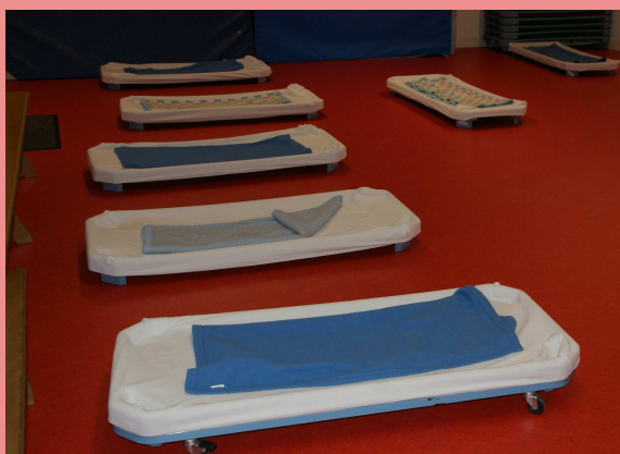
La salle de repos