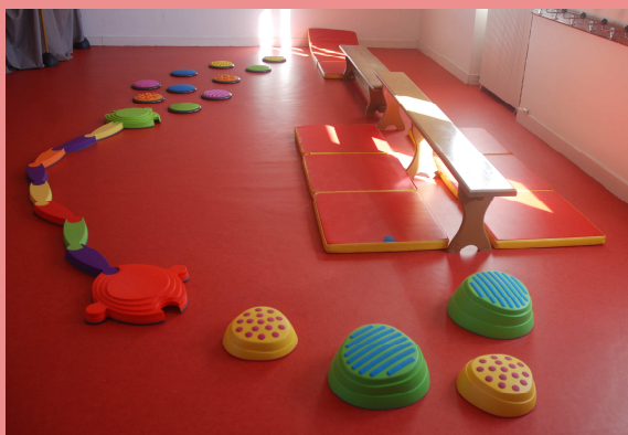
La salle de motricité