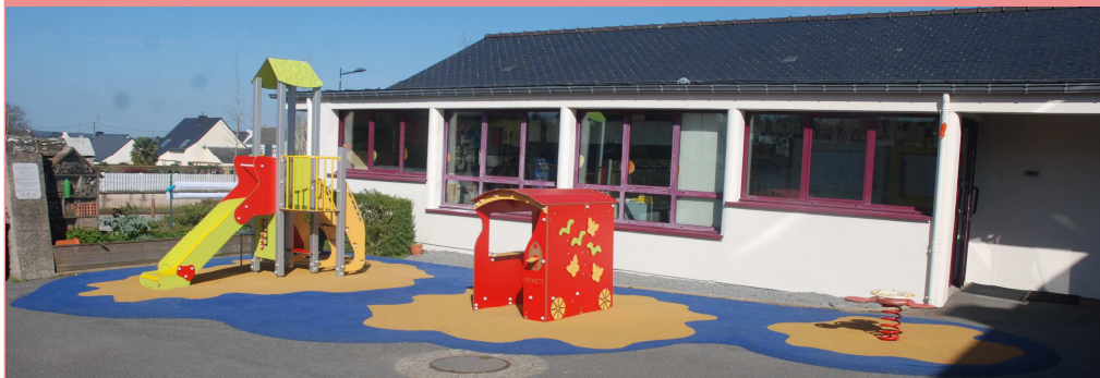
La classe maternelle et la cour